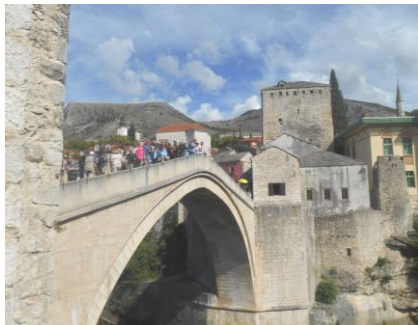
Fot.52. Słynny most w Mostarze