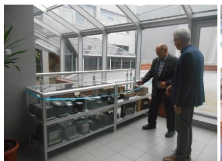
Fot.57. Nowe gabloty dla muzeum Almaria