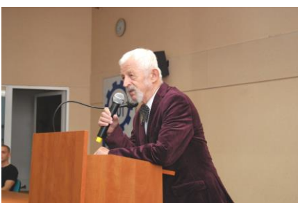
Fot.64. Wystąpienie Jubilata