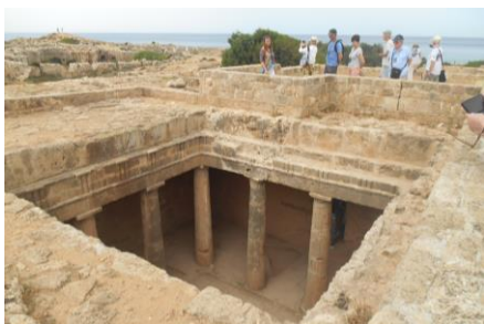
Fot.23. Grobowce Królewskie niedaleko Pafos