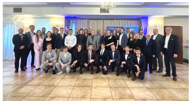
Fot.19. Uczestnicy Gali III PDME 2025

i obejmował m.in.: prezentacje techniczne, konkursy z zakresu wiedzy elektrycznej, szkolenia tematyczne, panel dyskusyjny pt. „Po co mi studia? - o roli wykształcenia w rozwoju zawodowym”, prezentacje firm sponsorskich, targi pracy i technologiczne, spotkania integracyjne (przy grillu też!), posiedzenie Stu-