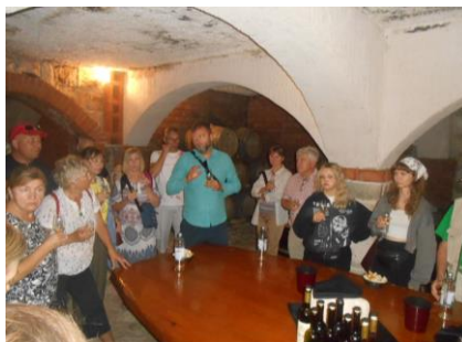
Fot.55. Degustacja win i serów