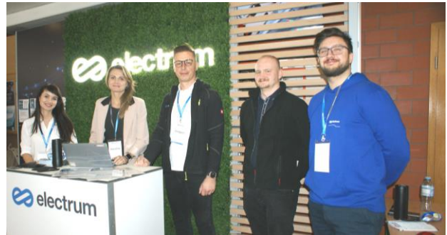
Fot.17. Stoisko firmowe podczas Targów pracy w kulkarach III PDME 2025