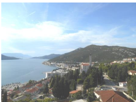
Fot.51. Piękne krajobrazy Chorwacji