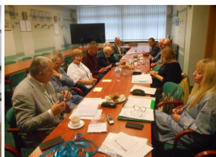
Fot.59. Posiedzenia Zarządu Oddziału