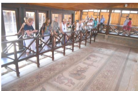
Fot.24. Słynne mozaiki podłogowe w Pafos