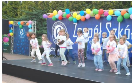
Fot.37. Gościwny występ przedszkolaków