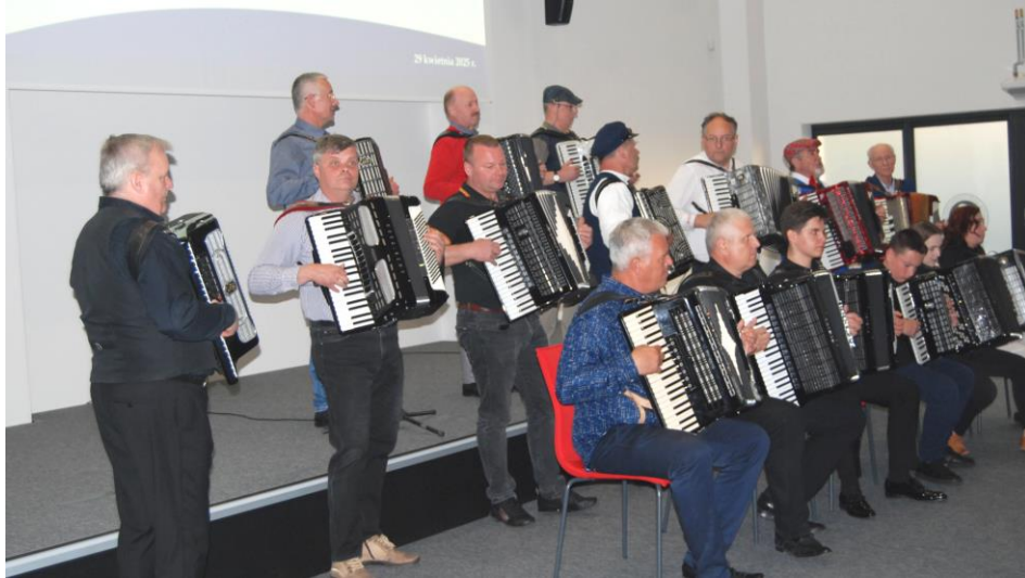
Fot. 15. W akcji aż 18 akordeonistów podczas koncertu „Wiosna z akordeonem”