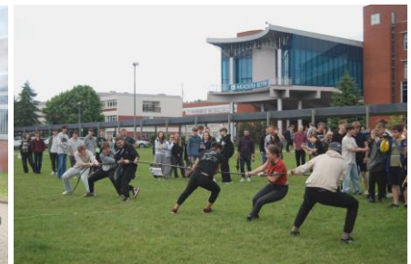
Fot.47. Zawody w ramach „Elektrycznego trójboju - przeciąganie kabla

kusyjny z udziałem przedstawicieli sponsorów i nauczycieli akademickich. Potem przeprowadzono konkurs „Elektryczne 1 z 10”. W kuluarach imprezy na swych stoiskach firmy przedstawiały oferty pracy, a na terenach zielonych przeprowadzono konkurs „Elektryczny trójboj”. Funkcjonował tam też studencki grill ze swymi smakołykami