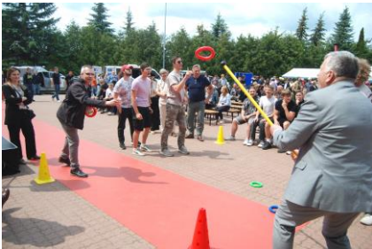
Fot.39. Konkurs łapania kótek na kij