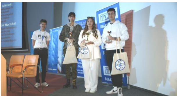
Fot.18. Laureaci konkursu „wiedzewego”