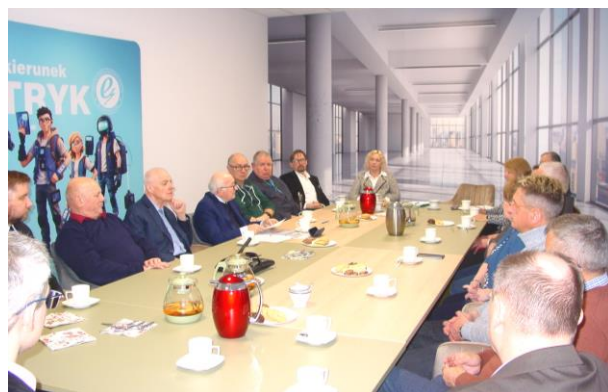
Fot. 4,5,6,7. Zwiedzanie laboratoriów CKZ i posiedzenie Zarządu Oddziału SEP