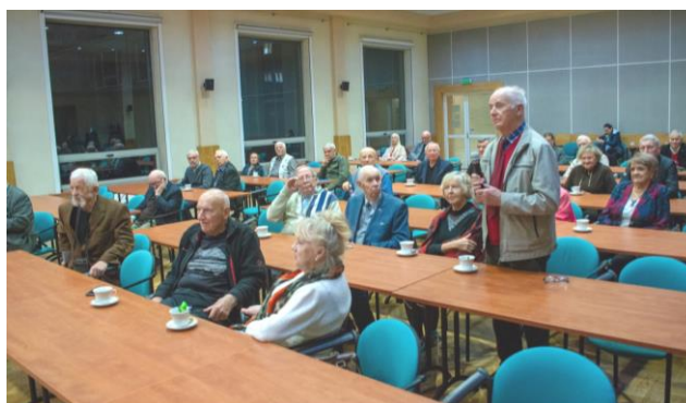
Fot.67. Uczestnicy XIV Inżynierskiej Środy