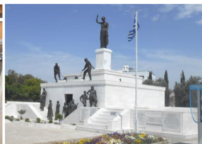
Fot.25. Pomnik Niepodległości w Nikozji

ace, Limassol, Nikozji (z przejściem na stronę okupowaną przez Turcję), słynnych mozaik w Pafos, czy legendarnego miejsca narodzin Afrodyty z piany morskiej, a także degustacja pysznych miejscowych win i serów oraz plażowanie nad ciepłym Morzem Śródziemnym - Foto Paweł Mytnik.