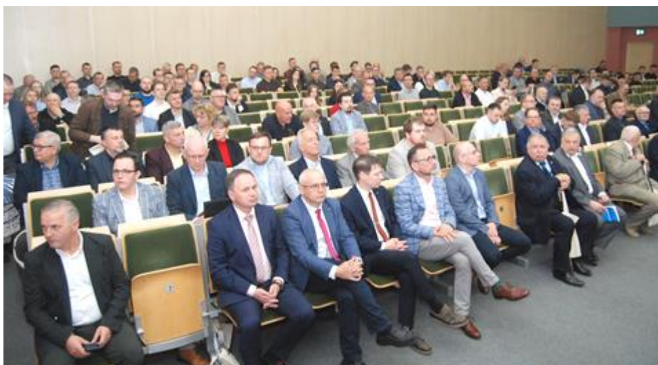
Fot.26. Uczestnicy XXII edycji seminarium ELSEP 2025

ków zainteresowanych tematem „ Stabilne źródła energii elektrycznej a bezpieczeństwo systemu elektroenergetycznego ”. Wygłoszono 7 referatów, których opracowania są dostępne w numerze 5/2025 „ Wiadomości Elektrotechnicznych ” jako materiały seminaryjne. Gościem specjalnym był Prezes SEP kol.