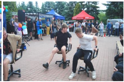
Fot.38. Wyścig na fotelach na kółkach