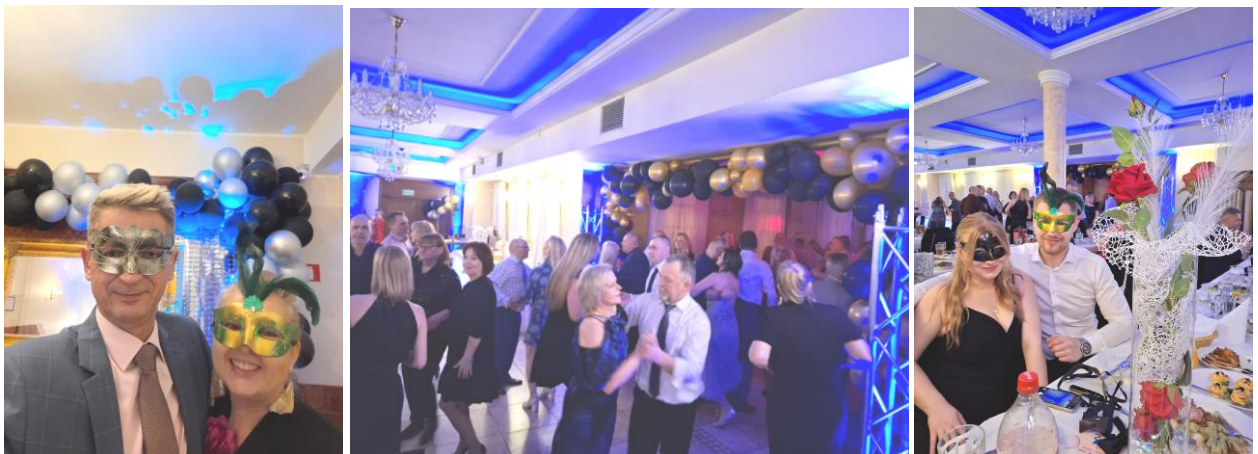
Fot. 12,13,14. Uczestnicy Maskowego Balu Elektryka 2025