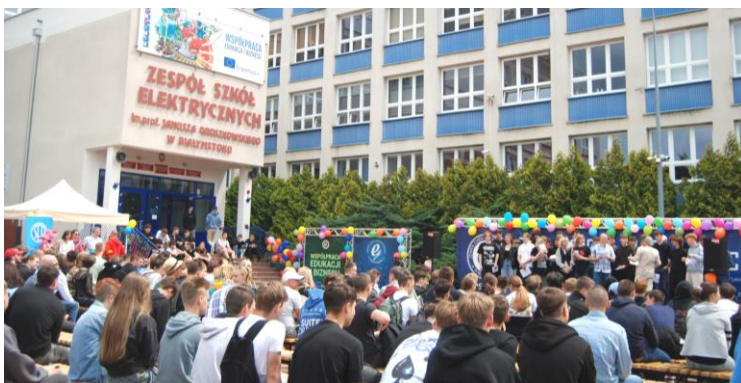
Fot.35. Festyn Rodziny Elektryka 2025 na terenie dziedzińca szkoły