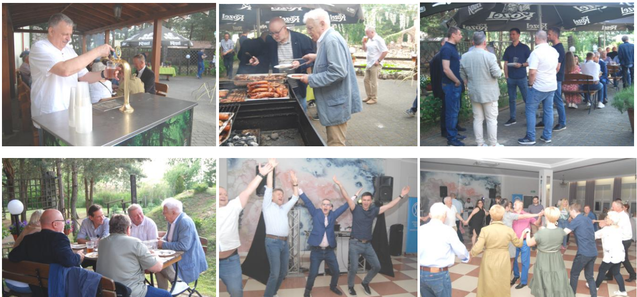
Fot. 29-34. Migawki z oddziałowego spotkania integracyjnego Białostocko 2025 z okazji Dnia Elektryka 2025

2025 r. w Białymstoku k. Białogostoku w ośrodku „Sosnowe Zacisze”. W imprezie wzięło udział około 75 uczestników. Nie brakowało dań z grilla, piwa z beczki, dobrego jada i napitków oraz muzyki serwowanej przez DJ-a. Dobra atmosfera sprawiła, że żal było wracać do domu.