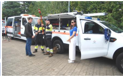
Fot.43. Prezentacja wozów aparatowych PGE