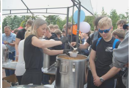
Fot.41. Smaczny bigosik proszę....