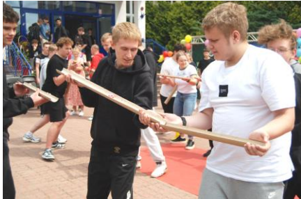
Fot.40. Konkurs toczenia kulek w rynienkach