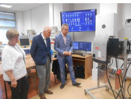
Fot.58. Wizyta w laboratoriach