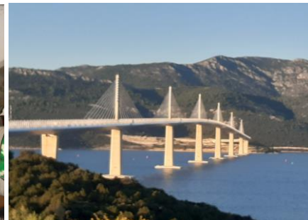
Fot.56. Majestatyczny Pelješki Most

ników, którzy zwiedzili m.in. Dubrownik, Mostar, Trogir, Split, Medjugorie, Ston oraz wyspę i miasto Korčula. Przywieźli trochę rakiji i moc wrażeń.