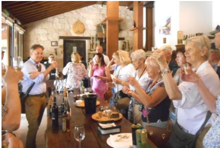
Fot.21. Degustacja serów i win w Omodos