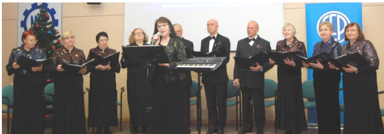
Fot.6. Chór „Cantylena” podczas występu