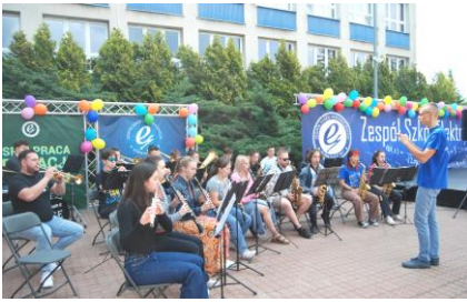
Fot.36. Występ orkiestry dętej ZSE