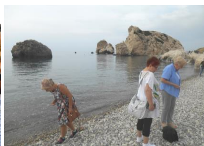
Fot.22. Mityczne miejsce narodzin Afrodyty