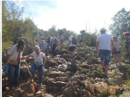
Fot.53. Kamienista ścieżka w Medjugorie