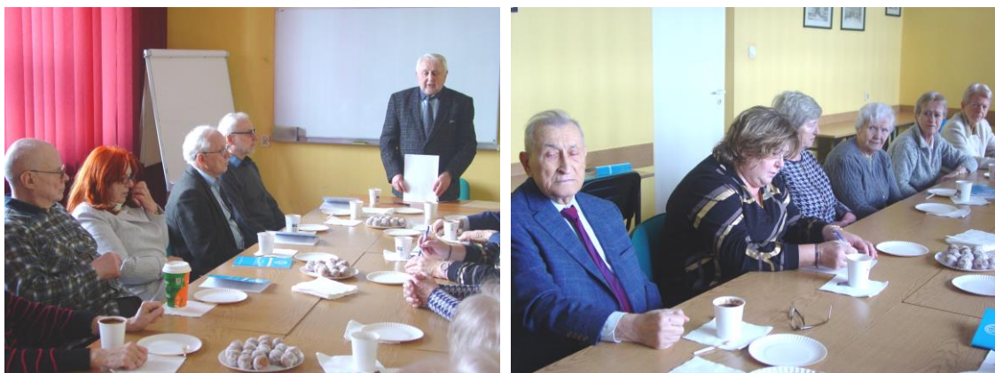
Fot.2 i 3. Podczas Spotkania Noworocznego Koła Emerytów Energetyków