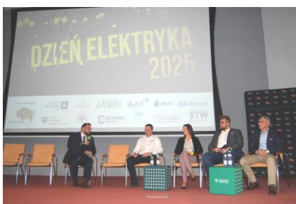
Fot.45. Podczas panelu dyskusyjnego