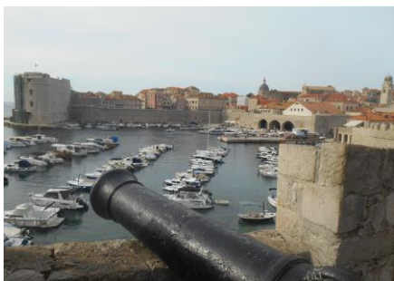
Fot.54. Widok na piękny Dubrownik