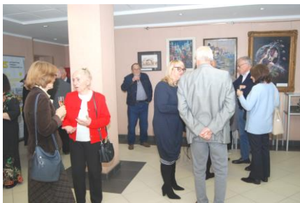
Fot.61. Wernisaż wystawy „Moje skarby...”