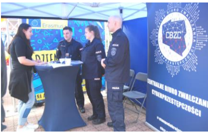
Fot.42. Stanowisko podlaskiej policji