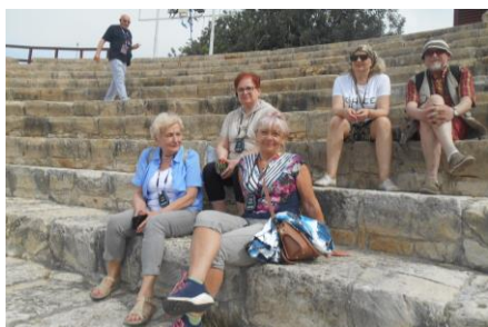
Fot.20. W rzymskim amfiteatrze w Kourion